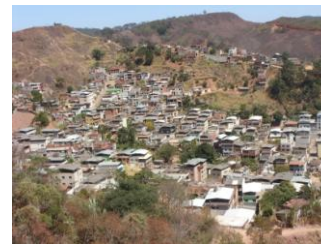
Vista parcial da comunidade