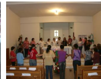
Ofício Divino das Comunidades e Celebração da Palavra