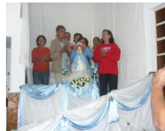
Participação na novena de N.S. de Fátima e Coroação